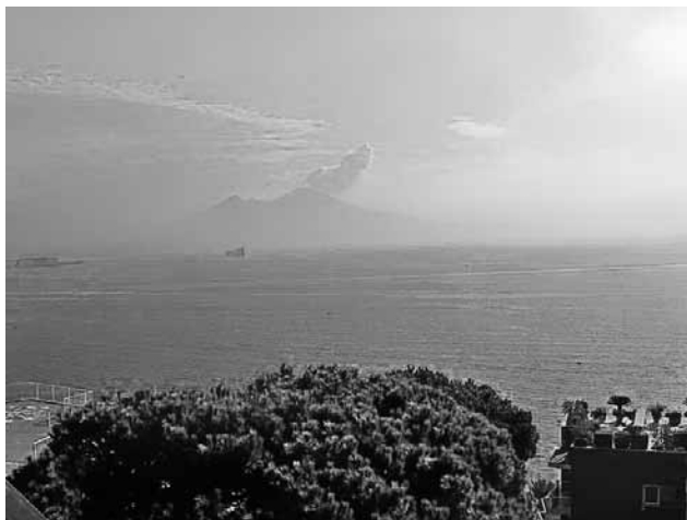
Везувий в тумане

верх, к стенам замка и монастыря. Здесь во времена оны свершилось немало трагедий и предательств, но за фактами и событиями не хотелось лазать в Историю, даже отечественную, связанную с этим местом. Нет, грубые камни, разогретые ароматы кипарисов и туй внушали сильнее: мы живы, мы здесь и сейчас!