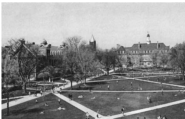
Двор Иллинойского университета

английского литературного магазина» — лучшее, что я придумал в этом направлении. Мне казалось, что от такого словесного самородка дело сразу заботается. Но — не заработало! Пусть хоть сама находка не пропадет, дарю подсказку — заинтересованные читатели найдут ее через пару страниц.