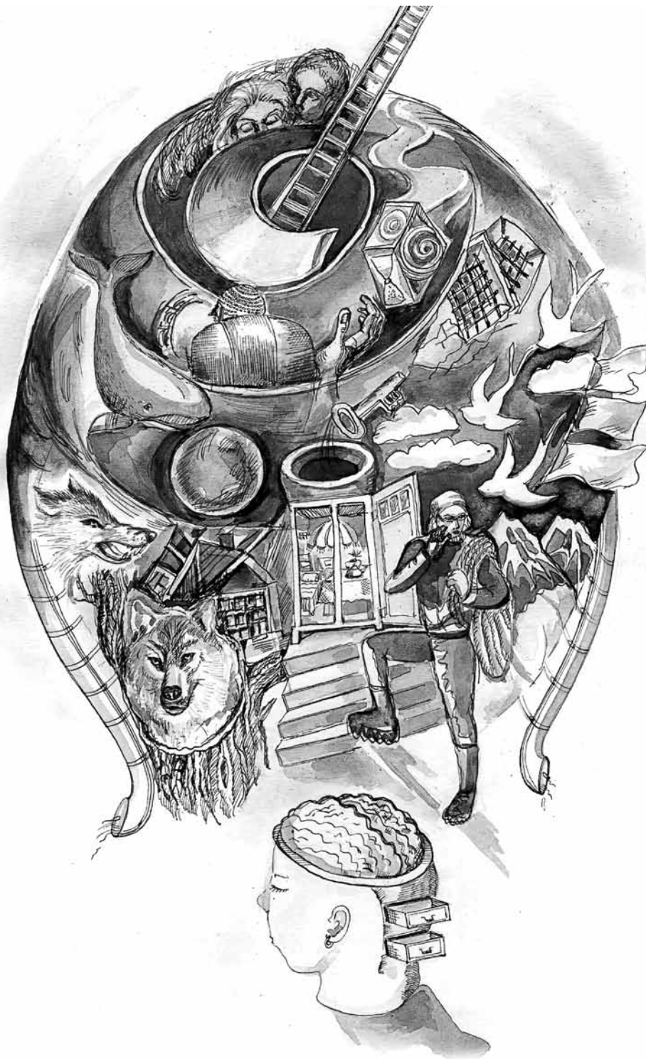
Иллюстрация Антонины Решетниковой