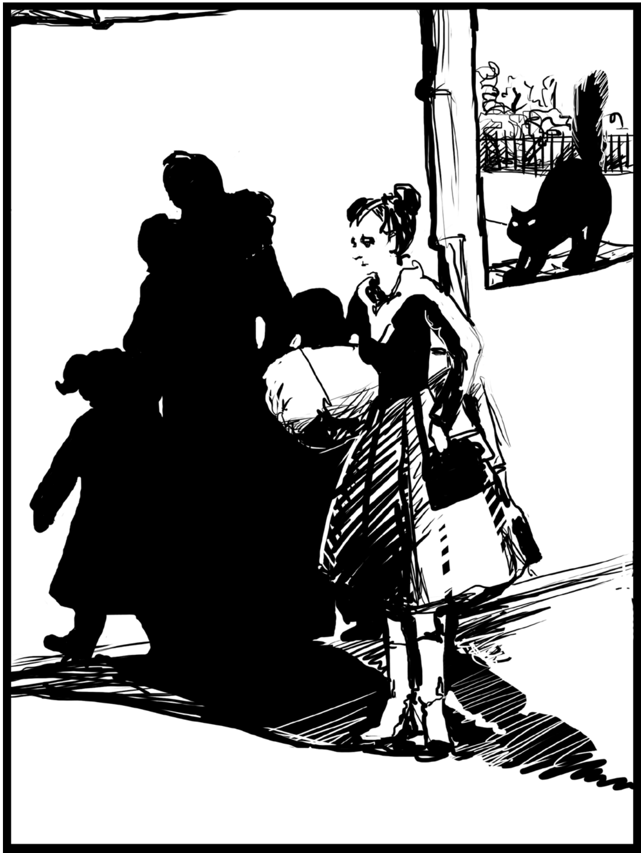
Иллюстрация Елизаветы Горяченковой